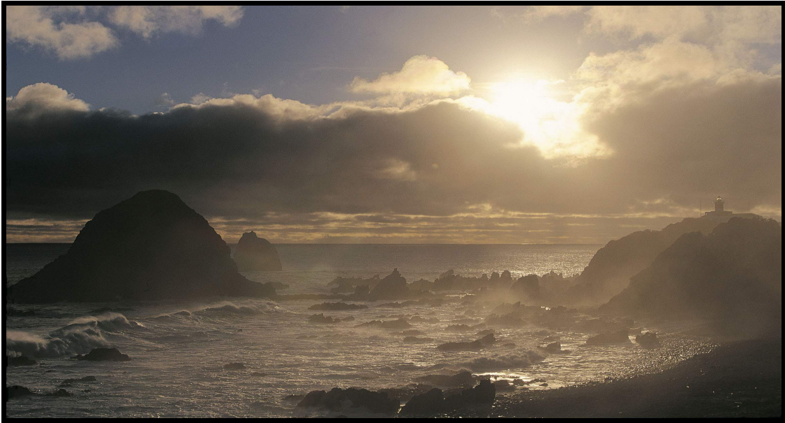
Tramonto a ovest